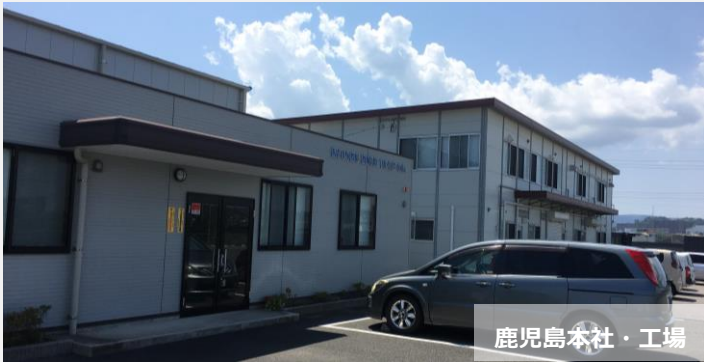
鹿児島本社・工場