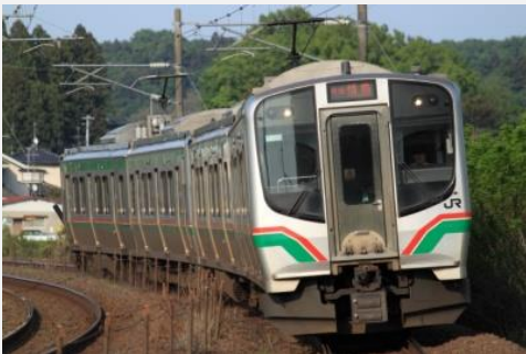
↑ JR東日本 E721系車両

鉄道車両での採用は今回初めてとなりますが、世界一安全で正確なJR車両の、多数のお客様が乗降する過酷な環境下での維持性を評価いただけたことは、品質の証しであると自負致しております。ご期待に違