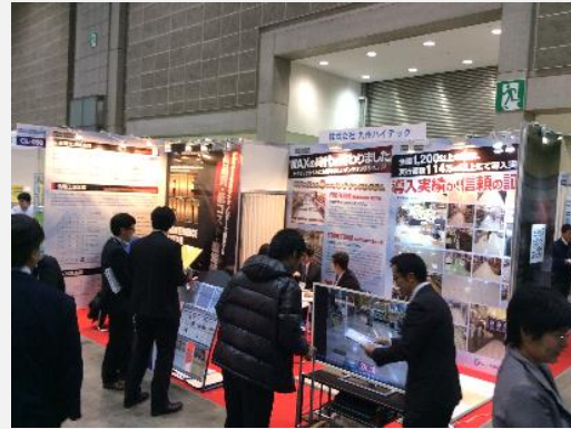
↑ クリーン EXPO 2015

去る 11 月 25 日（水）～27 日（金）、東京都江東区有明の東京ビッグサイトで開催の「クリーン EXPO2015」 第 2 回 施設メンテナンス・清掃サービス展に出展いたしました。今回、新商品として、有機溶剤を含まない「水性コーティング」及び石材研磨に代わる「石材コーティング」システムを発表。期間中 600 名を超える弊社ブースへの来場と、200 社近い名刺交換をいただき、