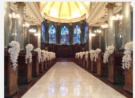
↑ 導入事例（結婚式場）

盛況のうちに終了することができました。「水性コーティング」は従来の溶剤系と比べて低臭・不燃性ケミカルのため、安全面に配慮が必要な病院や老健施設などでも使用が可能となりました。また、「石材コーティング」システムは、石材床の表面に、薄いガラス状の塗膜を形成し、その塗膜を研磨することで光沢還元管理することができる、世界にも類を見ない画期的なシステムです（特許出願中）。砥石の番手を変えつつ研磨を繰り返すしかなかった従来工法と比較して工程数を減らせるだけでなく、深みのある光沢感の実現や、耐候性、耐薬性、防滑性の付与など、付加価値のご提案ができることも評価を頂きました。材料購入の条件となる、指定業者登録制度についても複数の照会いただき、来場者の関心の高さが伺えました。展示会については年明け 2 月開催のスーパーマーケットトレードショー2016、3 月開催の建築・建材展 2016 に今年も出店致しますので、改めてご案内したく考えています。