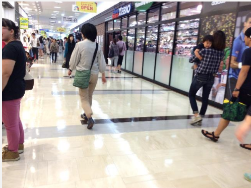
↑ 導入事例（ゆめタウン光の森）

同社は、新店では基本的にセラミックタイル床を採用されているものの、フードコートについては、子ども連れのファミリー層に配慮して、塩ビ系タイルを採用されており、清掃管理を一手に引き受ける、グループ子会社のイズミテクノさまにとっては、ワックス管理が課題でした。当初、