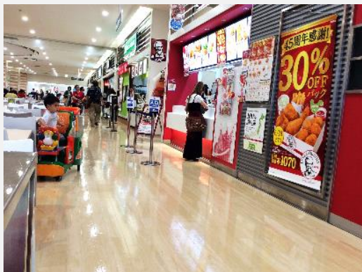
↑ 導入事例（ゆめタウン広島）

マート（熊本）等で順次ご採用頂けるようになり、今後もワックス管理で維持が難しい箇所については、随時ご検討を頂いています。築年数の古い店舗においては、状態が劣化したテラゾーやセラミックタイル等の管理に苦慮されているところも有り、塩ビ床だけでなく、石材系床についても対応できる、弊社のメンテナンスシステムには、評価と期待の声を頂いています。